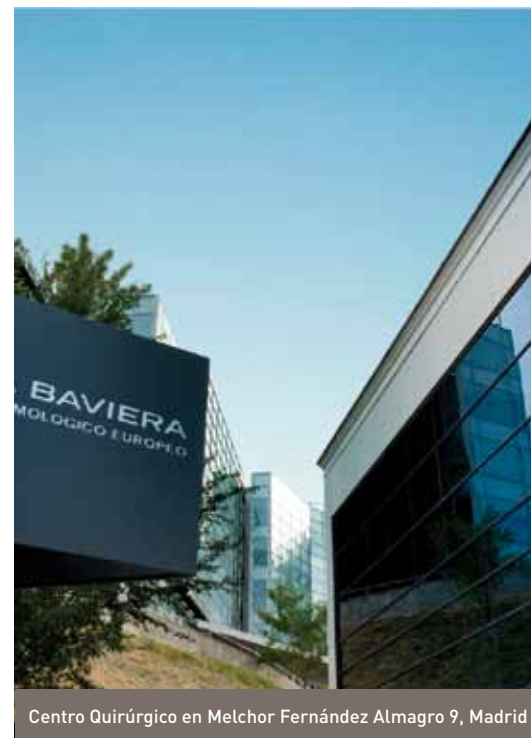
Centro Quirúrgico en Melchor Fernández Almagro 9, Madrid

Ya es hora de elegir al líder en oftalmología avanzada.